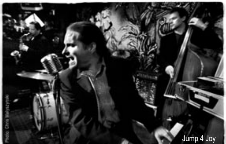
Jump 4 Joy