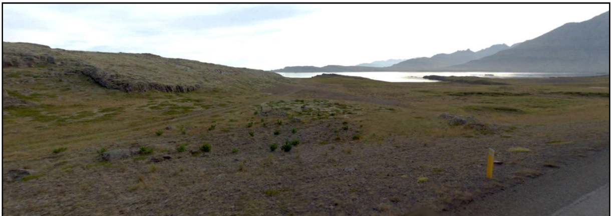
Mynd 2. Horft til suðvesturs frá Hringvegi niður að bótinni þar sem landtak í landi Þiljuvalla er fyrirhugað. Búlandstindur er til hægri. (Ljósm.: ja.is).

Í gildandi skipulagi er gert ráð fyrir að fyrirhugaður ljósleiðari liggi til vesturs og að landtak norðan Berufjarðar sé vestan Blábjarga. Í breytingu á aðalskipulagi er fyrirhugaður ljósleiðari á þessum kafla felldur út og þess í stað gert ráð fyrir að í landi Þiljuvalla sveigi ljósleiðari til suðvesturs frá Hamraborg og að landtaki í bótinni milli Hvaltanga og Meltanga norðan Berufjarðar, í námunda við landtak núverandi ljósleiðara sem þvera fjörðinn.