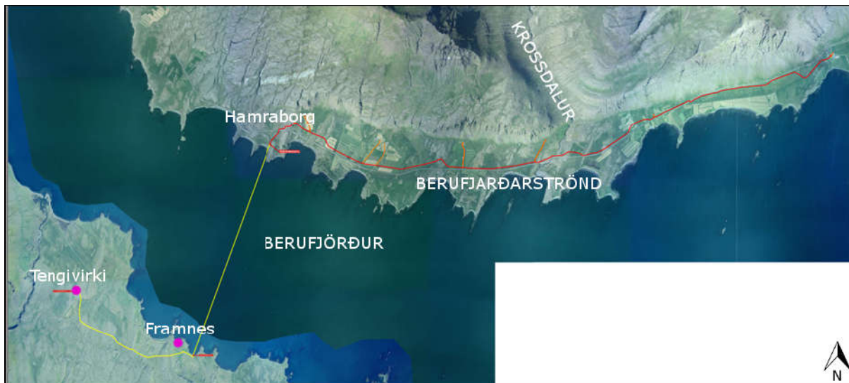
Yfirlitsmynd 1. Fyrirhuguð lega ljósleiðara um Berufjarðarströnd, yfir Berufjörð og að tengivirki í landi Teigarhorns. (Teikning lagnaleiðar: Mannvit).

Hellisvík, nokkru utan við Framnes. Frá landtakinu er gert ráð fyrir að ljósleiðarinn liggji inn að tengivirki RARIK í landi Teigarhorns. Í framlögðum gögnum er gert ráð fyrir að í landi Teigarhorns muni ljóslögn liggja samsíða vatnslögn Djúpavogshrepps eins og kostur er. Heildarlengd ljósleiðarans er 16,67 km, og þar af eru 2,2 km innan Teigarhorns og 3,7 km í sjó (sjá yfirlitsmynd 1).