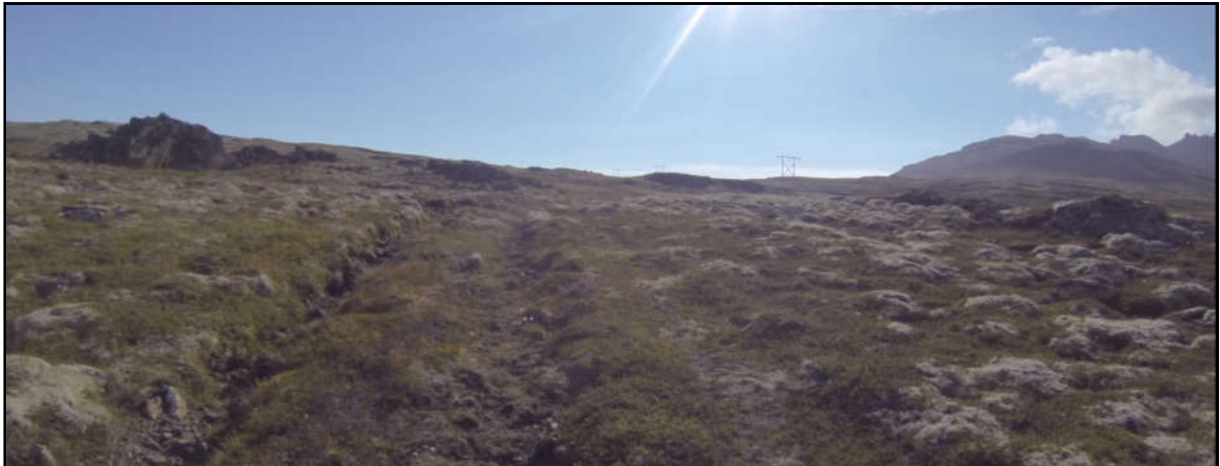
Mynd 5. Horft til suðausturs eftir akfærum göngustíg innan fólkvangsins á Teigarhorni sem fylgir stofnlögn vatnsveitu. (Ljós. Andrés Skúlason).

Mun ljósleiðarinn liggja samsíða stofnlögn Vatnsveitu Djúpavogshrepps að langsamlega mestu leyti. Með lögninni er vegslóði sem skilgreindur er sem akfær gönguleið í deiliskipulagi. Á þessum kafla hefur því landi verið raskað nú þegar. Í um 500 m fjarlægð frá tengivirkinu mun ljósleiðarinn sveigja frá vatnslögninni til norðurs að tengivirkinu. Á þeirri leið mun hann liggja samhliða núverandi ljósleiðara, sem liggur frá tengivirkinu til suðurs yfir Hálsa og þaðan út á Djúpavog.