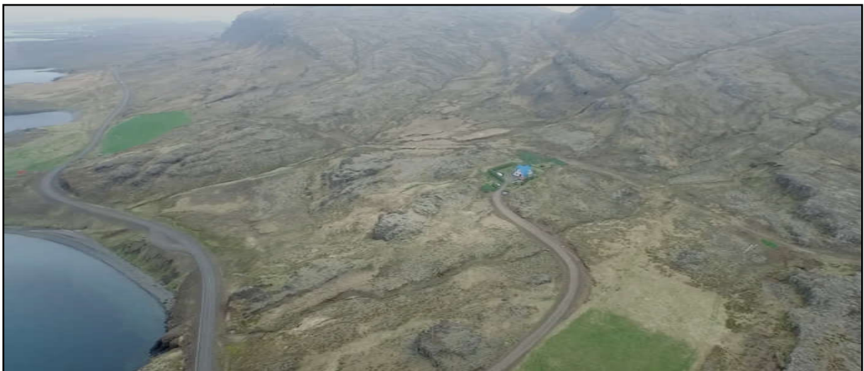
Mynd 4. Horft yfir land Djúpavogshrepps og fólkvangsins á Teigarhorni ofan við Eyfeyjunesvík. Akfær göngustígursem fylgir stofnlögn vatnsveitu liggur frá hægri til vinstri, ofan við íbúðarhúsið í Kápugili og áfram í átt að Hellisvík sem er lengst til vinstri. (Ljósm. Andrés Skúlason).

Í gildandi skipulagi er gert ráð fyrir að fyrirhugaður ljósleiðari liggi frá landtaki í Svarthamarsvík að tengivirki í landi Teigarhorns. Í breytingu á aðalskipulagi er sú lögn felld út en þess í stað er gert ráð fyrir ljósleiðara frá Hellisvík um land Djúpavogshrepps og fólkvangsins á Teigarhorni, inn að tengivirki í landi Teigarhorns.