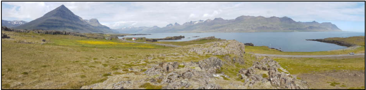
Mynd 3. Horft yfir Hellisvík til hægri og land Djúpavogshrepps sem ljósleiðari mun liggja um. (Ljósm. Páll Jakob Línal).

Í gildandi skipulagi er gert ráð fyrir legu fyrirhugaðs ljósleiðara í sjó frá landtaki vestan Blábjarga að landtaki í Svarthamarsvík sunnan Berufjarðar. Í breytingu á aðalskipulagi er fyrirhugaður ljósleiðari felldur út og landtakið sunnan fjarðar fært utar eða í Hellisvík í landi Djúpavogshrepps, skammt austan við bæinn Framnes. Á uppdrætti mun staðsetning ljósleiðara í sjó eðlilega fylgja færslu landtaka.