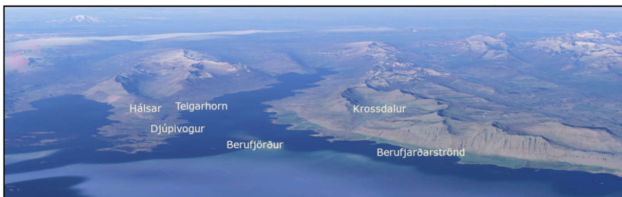
Yfirlitsmynd 2. Nyrðri hluti Djúpavogshrepps séð úr austri.

Berufjörður er nyrsti fjörðurinn innan marka Djúpavogshrepps. Berufjörður er um 20 km langur og kallast ytri hluti strandarinnar að norðanverðu Berufjarðarströnd. Á Berufjarðarströndinni rísa fjöll nokkuð bratt frá sjó og er undirlendi þar fremur lítið. Að sunnanverðu gegnt Berufjarðarströnd teygir lágreist Búlandsnesið sig til hafs en upp til vesturs rísa Hálsar sem skilja að Berufjörð og Hamarsfjörð. Enn vestar, handan Búlandsdals, rís eitt tignarlegasta og formfegursta fjall landsins, Búlandstindur (1069 m.y.s.).