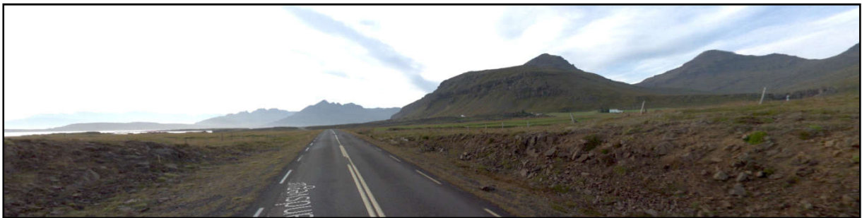
Mynd 1. Horft til vesturs eftir Hringvegi ofan við Lómasandsbót. Krossdalur til hægri.

Í gildandi aðalskipulagi er gert ráð fyrir að fyrirhugaður ljósleiðari liggi niður Krossdal til suðurs að Hringvegi ofan við Lómasandsbót. Í breytingu á aðalskipulagi er fyrirhugaður ljósleiðari á þessum kafla felldur út og þess í stað gert ráð fyrir að ljósleiðari fylgi Hringvegi að mestu leyti frá sveitarfélagamörkum í norðri að fyrrgreindum stað ofan Lómasandsbótar.