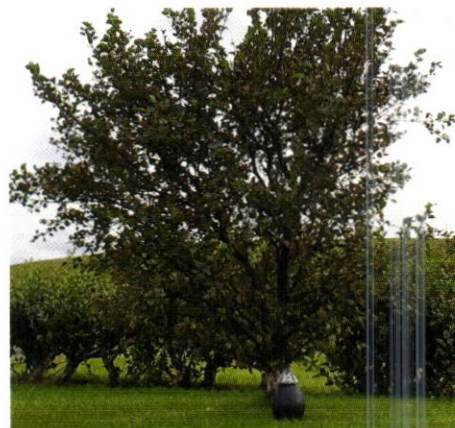
Duftker við tré. Úr kynningarmyndbandi

Tré lífsins er frumkvöðlaverkefni í þróun og skiptist í þrjá hluta. Fyrsti hlutinn er skráning hinstu óska í persónulegan gagnagrunn, annar hlutinn er rafræn minningasíða og þriðji hlutinn bálstofa og Minningagarðar. Sá hluti sem snýr að handhöfum skipulagsvaldsins eru Minningagarðar. Í Minningagarðana verður aska látinna einstaklinga gróðursett ásamt tré sem mun vaxa upp til minningar um hinn látna og vera merkt rafrænu minningasíðu þess sem undir því hvílir.